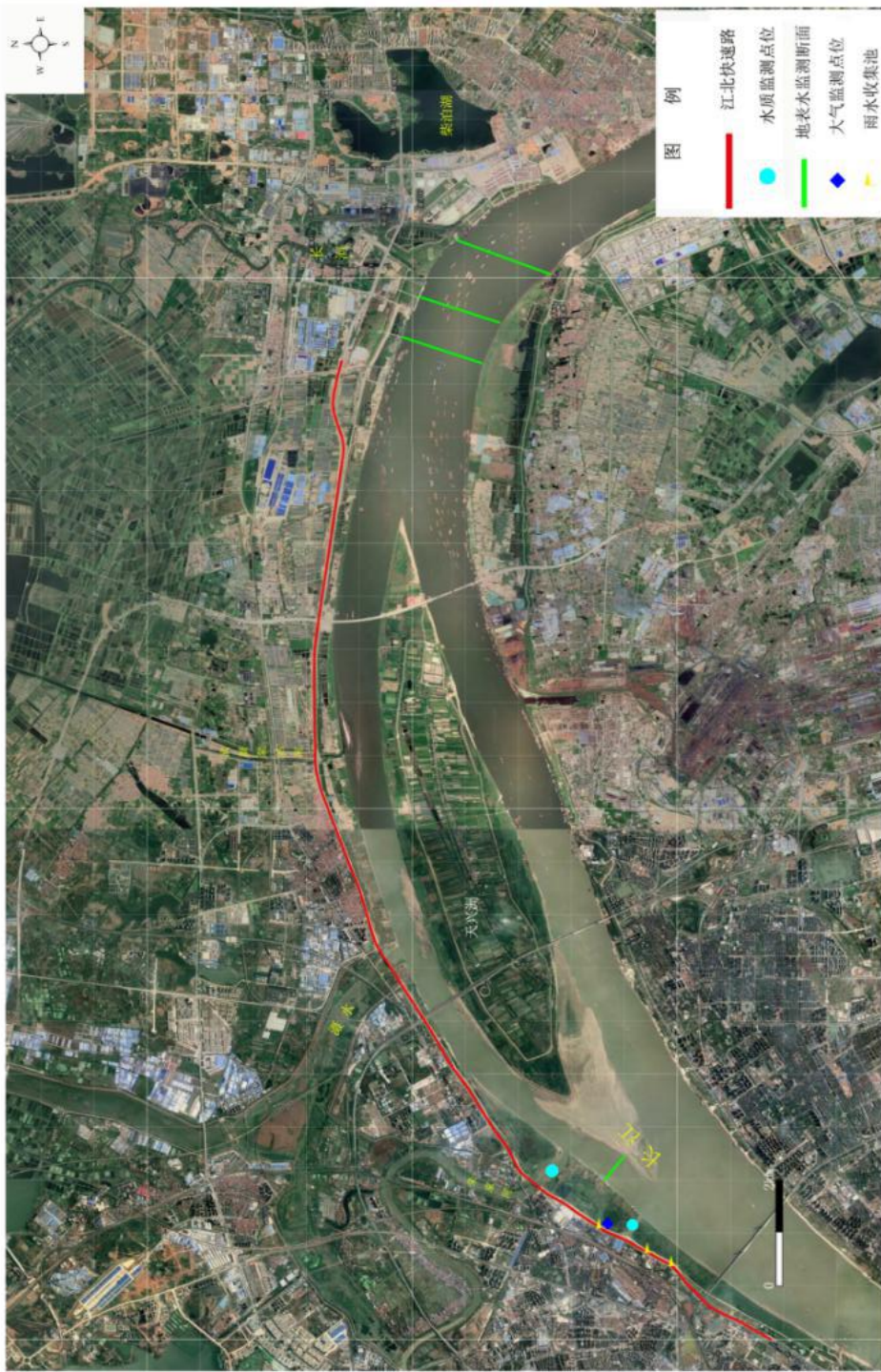
附图2 工程与地表水体位置关系图及监测点位图